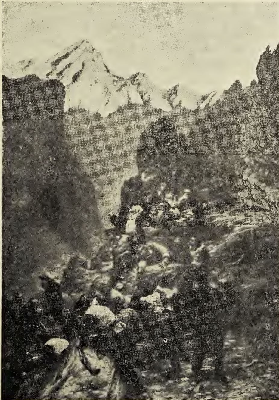
Cuadro, depositado en el Museo Cèrico de Turin, del Pintor S. Allason Un episodio de las persecuciones contra los Valdenses del año 1686 (Es el valle de Suliase en Bobbio-Pellice - A la izquierda la Rocha Cha- berta con un precipicio de 300 metros, en el fondo emerge la montaña del Courmour, altura 2898 metros)

Fué la nevada Suiza, La Suiza alegre y risueña, Y con esto nos enseña Que amor cristiano la anima.